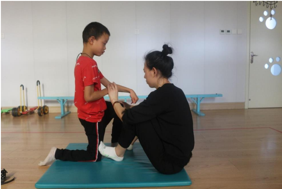
Foto: revalidatie door fysiotherapeute