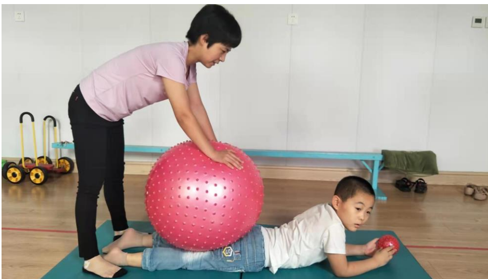
Foto: revalidatie door fysiotherapeute